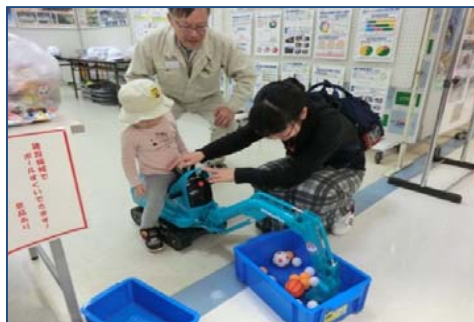
おかあさんと一緒にゲームに挑戦!