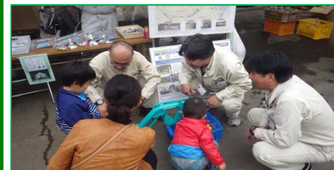
【こちらでもゲームは子供たちに人気!】