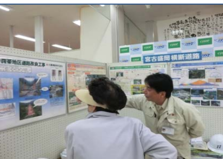
パネルを利用しながらの説明

ご意見・ご感想をお寄せ下さい。 国土交通省 東北地方整備局 三陸国道事務所 PPP宮古箱石工区 事業管理班 〒027-0029 宮古市藤の川4番1号 三陸国道事務所 東庁舎103号 (TEL) 0193-77-4733