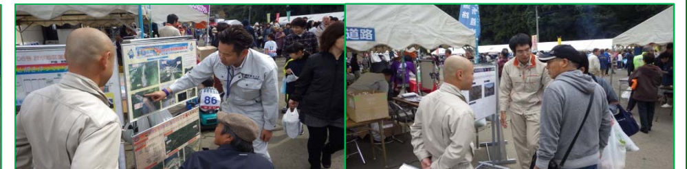
【パネルを利用して、工事の進捗状況を説明】