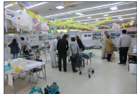
市民のみなさまとのふれあい