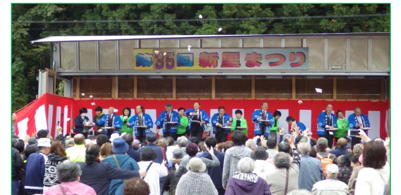
【多くの来場者で賑わった新里まつり】

平成29年10月15日(日)、「新里まつり」で宮古箱石道路の整備効果や工事の進捗状況を説明するため、パネル展を開催(宮古箱石道路安全協議会)しました。当日は、多くの方々にパネルを見ていただき、「工事中の道路はいつ開通するのか」といった質問に担当者は丁寧に回答していました。子供たちにはミニバックホウによるボールすくいゲームを楽しんでいただきました。