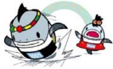
サーモンくん みやこちゃん