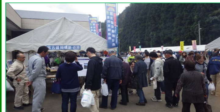
【多くの方に立ち寄りいただきました!】